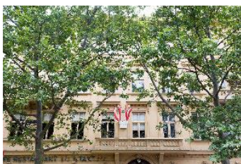
Johann Strauss Wohnung, Foto: Lisa Rastl, Wien Museum